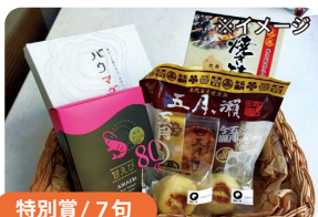
特別賞 / 7句