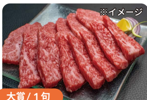
大賞 / 1句