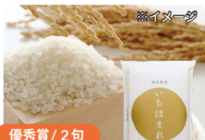
優秀賞 / 2句